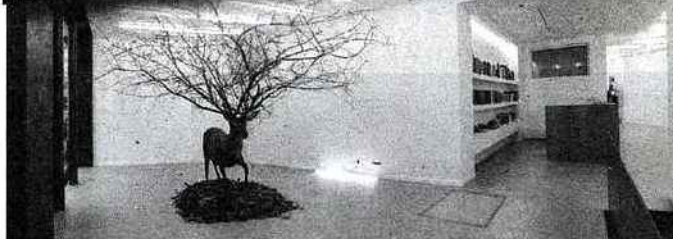
Galerie Paris-Beijing Elle représente l'artiste chinois Liu Bolin dont j'admire particulièrement le travail.