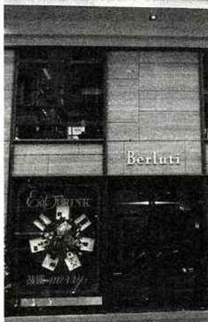
Berluti J'aime tout dans ce magasin, c'est l'élégance suprême.